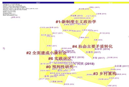
图2 文献共被引聚类知识图谱

对文献共被引知识图谱进行聚类运算,得到文献共被引聚类知识图谱(图2)。衡量聚类的清晰度一般用两个指标,即模块值(Q值)和平均轮廓值(S值), 0 \leq Q \text{ 值} < 1 。 Q > 0.3 时,意味着被划分出来的社团结构是明显的;当S值在0.5以上,聚类一般认为是合理的 [12] 。图2所显示的聚类图谱中,Modularity Q=0.6312 , Mean Silhouette =0.5498 ,表明文献共被引的聚类图谱是可信的。使用聚类算法共得到20个聚类,每个聚类都有一个明确的主题,由CiteSpace从该聚类施引文献的标题和关键词中提取出高频短语作为聚类名称。关于乡村振兴研究的前沿课题,总体上聚焦于以下几个视角: